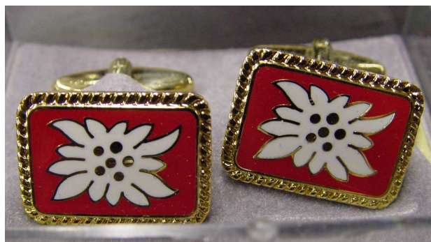
Manchettknöpfe mit Edelweiss, rechteckig oder oval