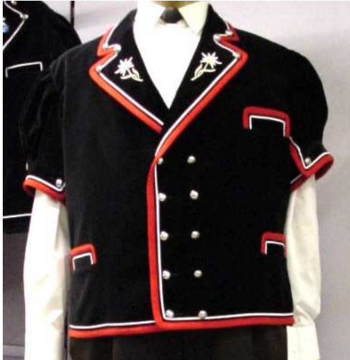
Samt Mutzli mit Edelweiss Stickerei