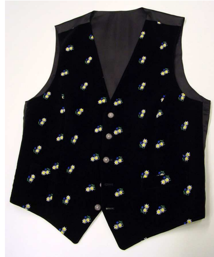
Gilet aus besticktem Samt